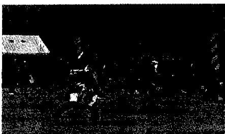
市民運動会の様子

女性防火クラブも地域の各種団体の方と共に、できる限り地域の方に情報提供ができるような活動をしていきたいと考えています。