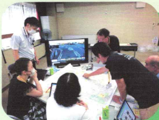
▲ Cテーブルでの話し合い