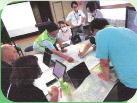
▲ Bテーブルでの話し合い