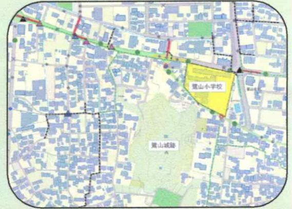
▲「危険箇所の見える化」地図