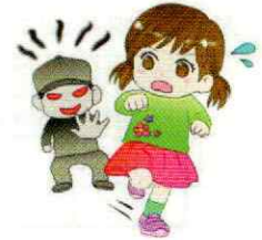
声かけ事案時間帯別発生状況

これからの季節は、例年子どもへの声かけ事案が増加しますので、十分注意しましょう。