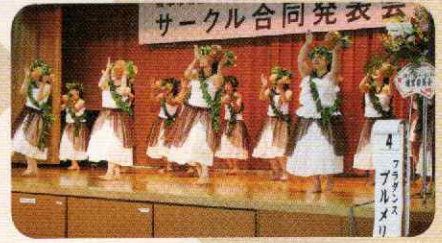
▲ハワイの楽器を使って