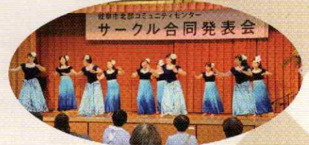
▲指先までしなやかに