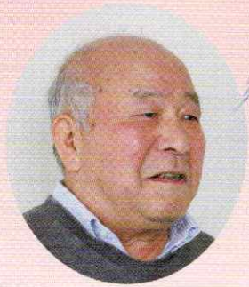
令和5年度 北部コミュニティセンター