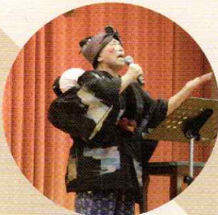
▲カラオケ「おしんの子守唄」