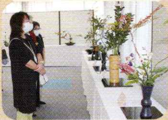
▲花の香りに魅せられて