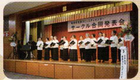
▲素晴らしいハーモニー