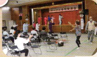
▲さあ 太極拳をご一緒に