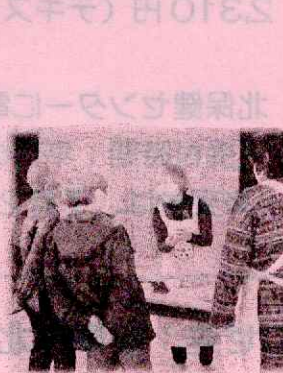
【公民館講座で講話】