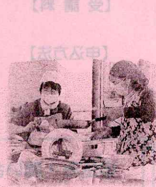
【活動に向けて勉強会】