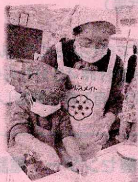
【キッズトントン教室】