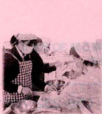
【高校生と調理実習】