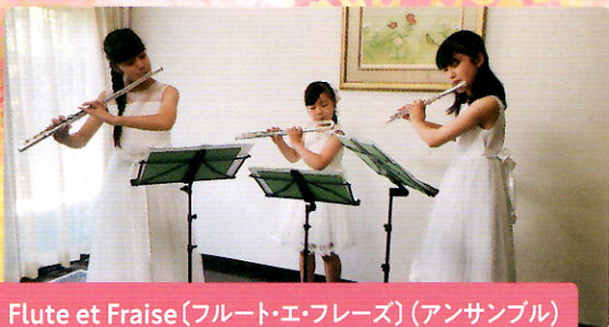
Flute et Fraise(フルート・エ・フリーズ)(アンサンブル)