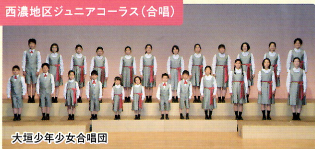
大垣少年少女合唱団