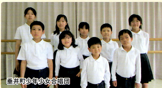
垂井町少年少女合唱団