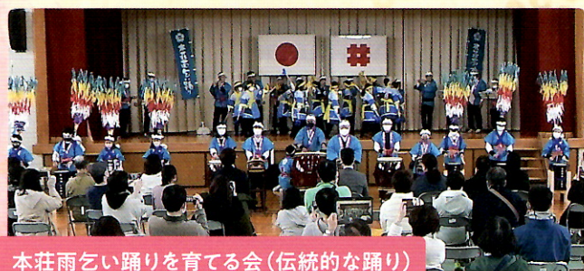
本荘雨乞い踊りを育てる会(伝統的な踊り)