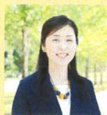
日本ライフオーガナイザー協会1級 マスターライフオーガナイザー