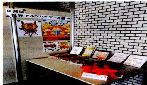
昨年度のアルツハイマー月間の取り組み

アルツハイマー病等に関する認識を高め、世界の患者と家族に援助と希望をもたらす事を目的とし、様々な取り組みを行っています。