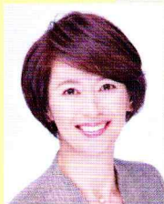
ありもり ゆうこ 有森 裕子