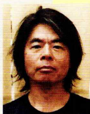
ひびの かつひこ 日比野 克彦