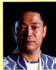
はやし えいてつ 林 英哲