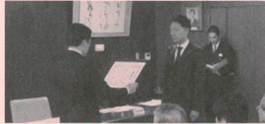
(左：岐阜市長 右：都筑会長)