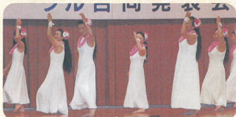
▲すてき〜 しなやかな動き!