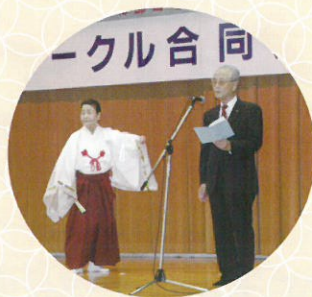
▲息もピッタリ 詩吟と舞