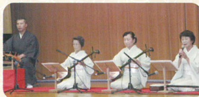
▲三味線のバチの音色も高く