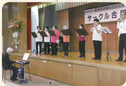
▲オカリナの美しい音色