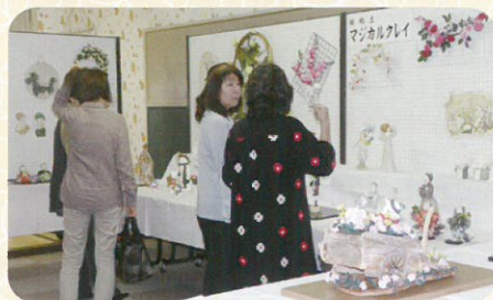
▲とても素敵な作品がいっぱい