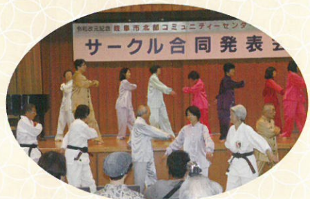
▲円を描く動作がきまり