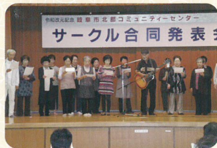
▲合唱 皆さんも一緒に