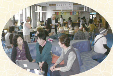
▲一番人気は「令和改元記念」ぜんざい