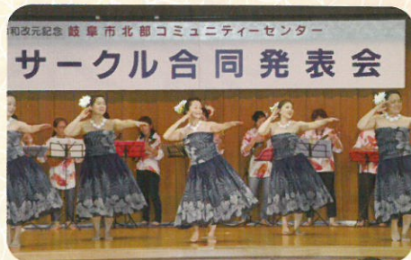
▲ウクレレの生演奏 アロハ〜♪