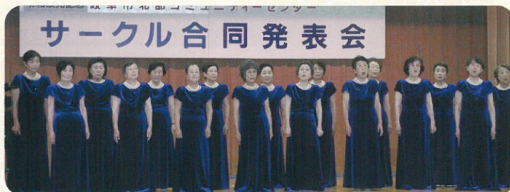
▲すばらしい大合唱♪〜