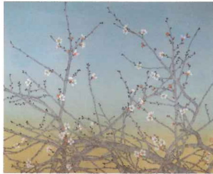
向井大祐「春寂寥」／長江洞画廊