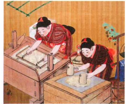
守屋多々志「紙漉」／後藤紙店