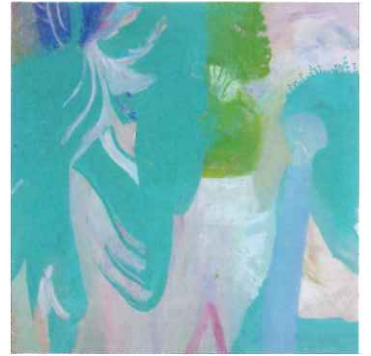
傍島幹司「グリーン GREEN」／柳ヶ瀬画廊