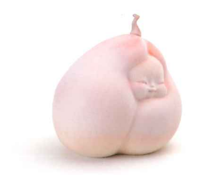
寺倉京古「まほらま」／田口美術