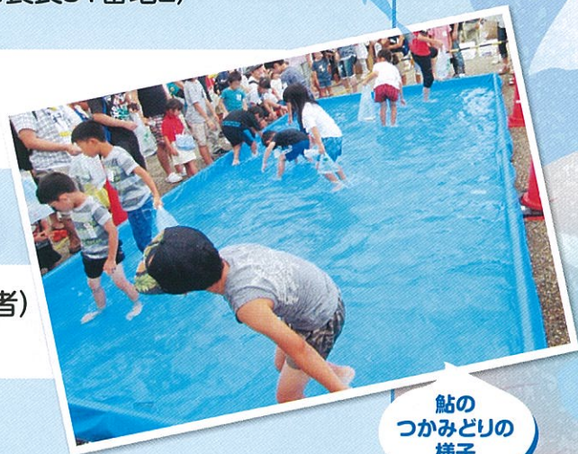
鮎の つかみどりの 様子