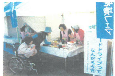
岐阜市環境まるとフェアでの様子

私たち生活学校は全国に400あり、今、みんな で「食品ロス削減全国運動」に取り組んでいます。 フードライブなどにも取り組んでいます。2年間 「食品ロス削減家計簿手帳」を付けてみて、食品ロ ス削減に効果があることが分かりました。