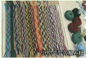
リトアニアの組み紐