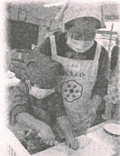
【キッズトントン教室】