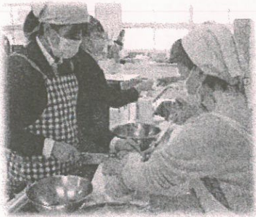
【高校生と調理実習】