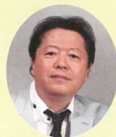
◆ゲスト タケカワ ユキヒデ