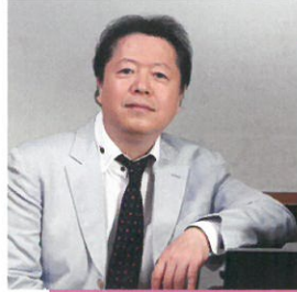
タケカワ ユキヒデ

埼玉県さいたま市生まれ、東京外国語大学(英米語学科)卒業 『ガンダーラ』『モンキーマジック』『銀河鉄道999』『ビューティフル・ネーム』など数々のヒットソングをもつソングライター・シンガー。人気ロックグループ「ゴダイゴ」(昭和51年結成)を経て、現在は、作曲家・歌手・ライブ・音楽プロデューサーなど、ソロアーティストとして活躍中。平成18年結成30周年を機に「ゴダイゴ」を再始動させ、ますます精力的な活動を展開。平成31年は「ビューティフル・ネーム」(国際児童年協賛ソング)発表から40周年となる。今回の歌謡ステージでは、往年のヒット曲をご本人の歌声でお届けいたします。