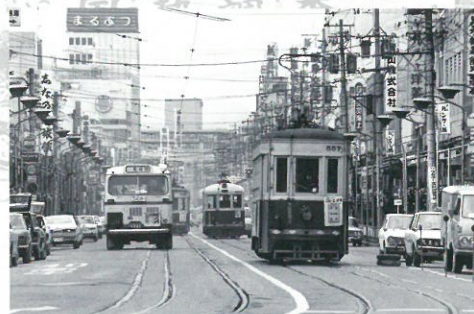
丸物百貨店が健在だった頃の神田町(現 長良橋通り)