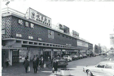
昭和34年にオープンした岐阜駅