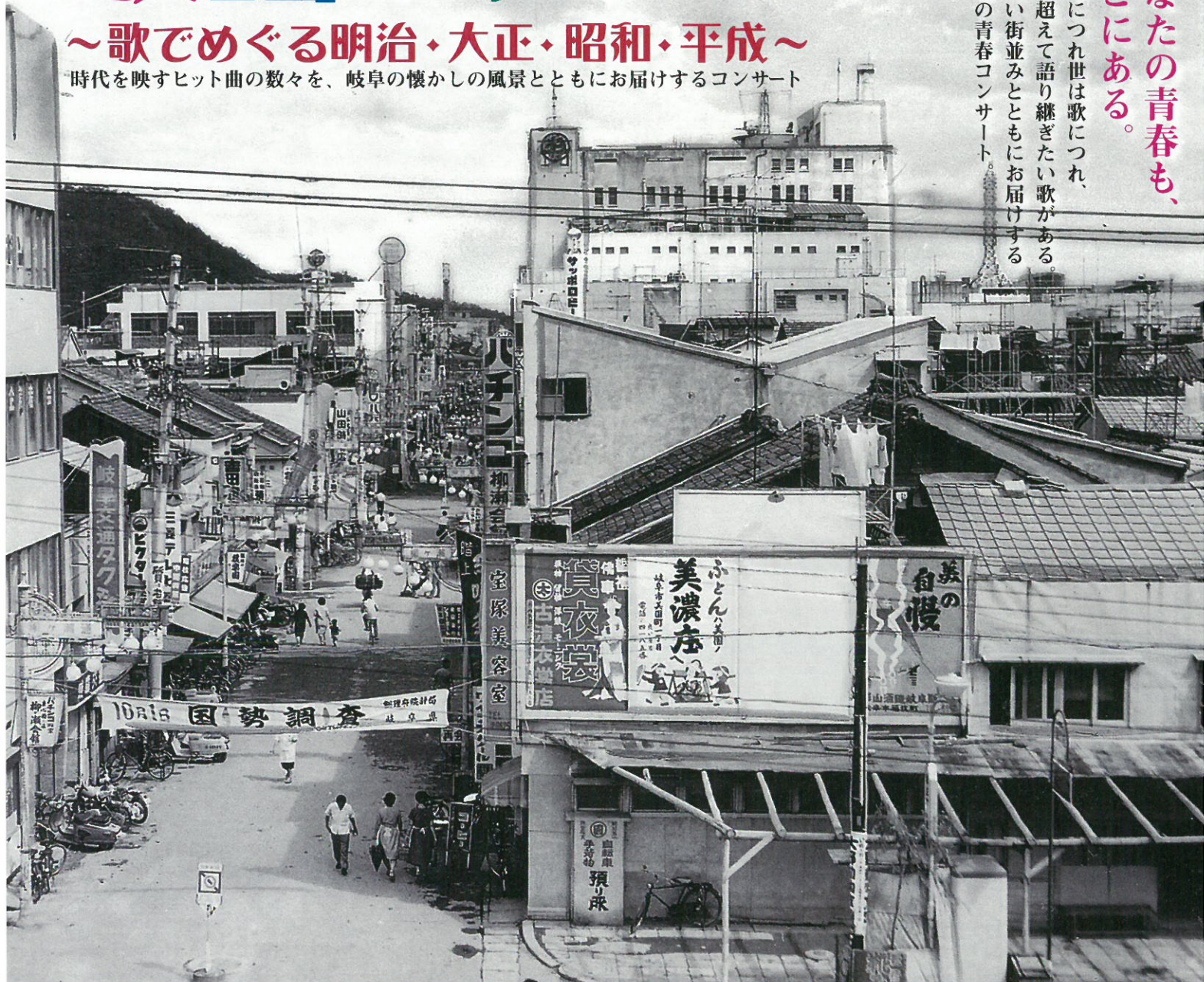
柳ヶ瀬通りを平和通りから眺めた昭和35年の風景

歌は世につれ世は歌につれ、 時代を超えて語り継ぎたい歌がある。 懐かしい街並みとともにお届けする みんなの青春コンサート。