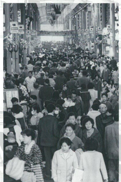
昭和41年の年末の柳ヶ瀬の賑わい