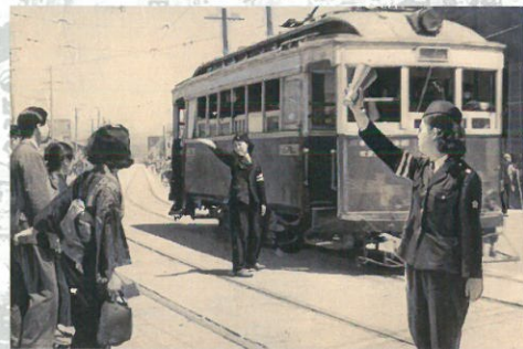
昭和30年頃の交通整理をする岐阜市警の婦警さん

岐阜市出身。サクソ奏者として19才でプロデビュー。数々のサポートバンドを経て22才で『本多俊之ラジオクラブ』に参加。「サムシング・カミング・オン」「東方見聞録」をリリース(東芝EM)。全国での演奏活動をはじめ、映画「マルサの女・2」「ミンボーの女」「スーパーの女」、テレビ朝日系列「ニュースステーション」などの音楽に演奏者として参加(作曲:本多俊之)。また平成6年から、『高橋真梨子ヘンリーバンド』に加入。複数のアルバム、毎年、全国ツアーに参加。『熱帯ジャズ楽団』結成メンバー。平成25年、平成27年～29年(高橋真梨子Henry Bandにて紅白歌合戦に出演。)'平成のおんなギター流し おかゆ'のプロデューサー。