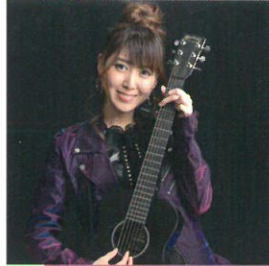
平成のおんな流し おかゆ

岐阜県揖斐郡池田町生まれ、飛騨・美濃観光大使 昭和63年『ホレました』でデビュー。平成15年『ふたり傘』にて「ベストヒット歌謡祭2003」ゴールドアーティスト賞、「第36回日本有線大賞」有線音楽賞受賞。同曲にて、その年のNHK紅白歌合戦に出演。平成30年9月デビュー30周年記念アルバム「詢風～吟詠の世界～」発売。平成24年「ぎふ清流大会(長良川競技場)」と平成27年「全国育樹祭(揖斐川町)」にて国歌独唱。今回の歌謡ステージでは、ご自身の曲に加え、様々な歌手のヒット曲も歌っていただく予定です。