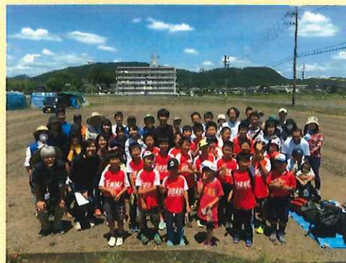
(岐阜市下鶴飼1丁目88番地3)