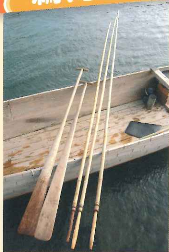
① 操船用具 (左: 櫂 かい 右: 棹 さお )