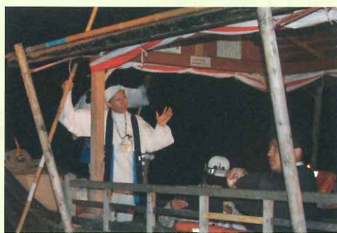
② 鵜飼の解説を行う様子