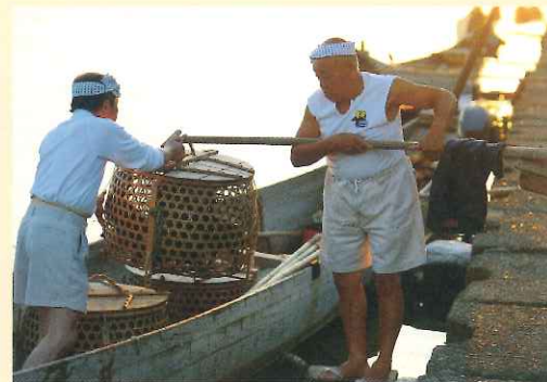
③ 鵜舟に道具を積み込む様子

国の文化財に指定されている長良川鵜飼。鵜舟の船頭は、鵜飼を支える重要な役割を担います。シーズン中に毎晩鵜舟を操船することに加え、鵜飼で使用する道具を鵜舟に積み込む作業など、鵜飼の準備全般も行い、鵜匠をサポートしながら日々仕事をを行います。