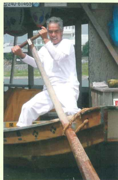
③ 櫂を使用する舳 (船尾側) の船頭