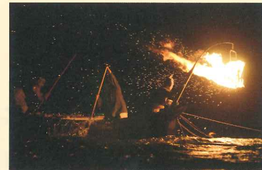
② 船乗り (左側の船頭) と中乗り (右側の船頭) が鵜匠と息を合わせて操船