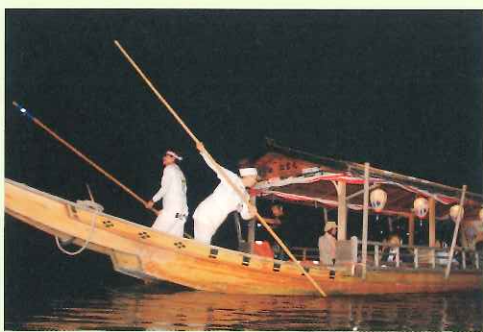
① 棹を使用する舳 (船首側) の船頭

観覧船の船頭は、鵜飼を引き立てる名脇役。乗客が安全かつ快適に鵜飼を楽しむことができるよう、船を自由自在に操ります。また、鵜飼の解説や、お茶の提供など、最大限のおもてなしをします。笑顔で粋に船を操る姿は、乗客を魅了します。