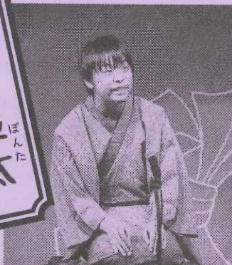
工学部機械工学科技術開発科17年

気がついたら六年目! 今年が最後の一年です! お客様の為にも後輩の為にも 一生懸命に頑張ります!