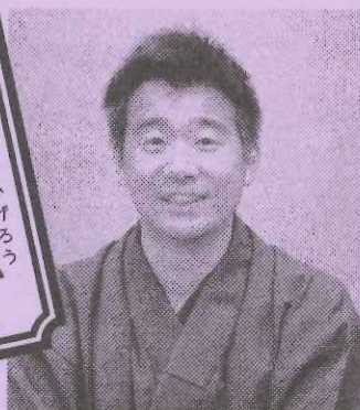
大学院自然科学技術研究科1年

落語に混じって講談を 読みます! 岐大落研初の試み ですが皆さんに楽しんでい ただけるよう頑張ります!