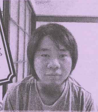
工学部機械工学科知能機械制御1年