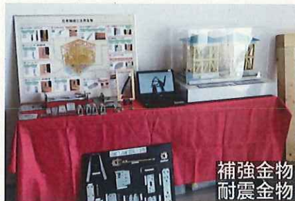
補強金物 耐震金物