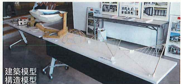
建築模型 構造模型