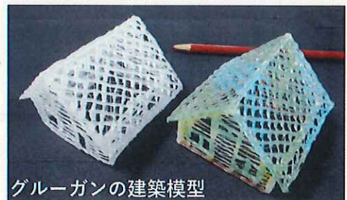
グルーガンの建築模型