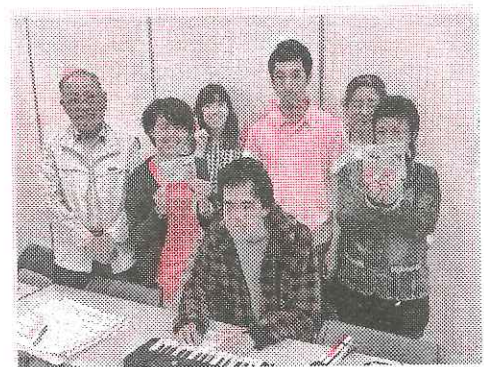
あんさんぶる♪メンバー