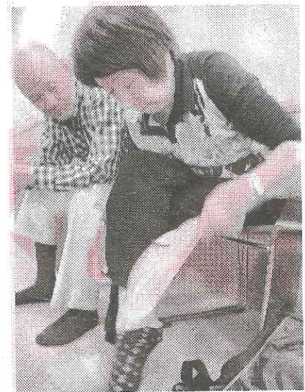
「便利グッズをお試し中」

相談された方の中には、お知り合いの方から質問を託されて来所された方もありました。今後も気楽にご相談いただける場として、「出張なんでも相談会」がご利用いただけるように、企画していききたいと思います。