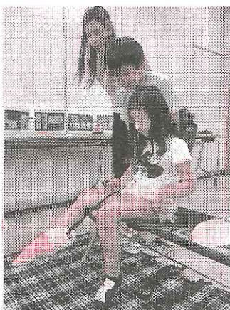
「ソックスエイド」体験中

てみよう！という工作教室を開催します。小学生は「ソックスエイド・お薬取り出しケース」、中学生は「万能カフ・バネ箸・ストロースタンド」の作成をしてもらいます。作品は持ち帰ってもらう事ができます。作成するものについての説明もあり、作成後の体験も出来ます。ぜひ、ご参加ください。参加費は無料です！！