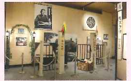
展示の様子(写真はイメージ)