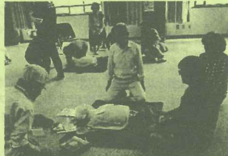
▲AED講習会! 内容を再確認!