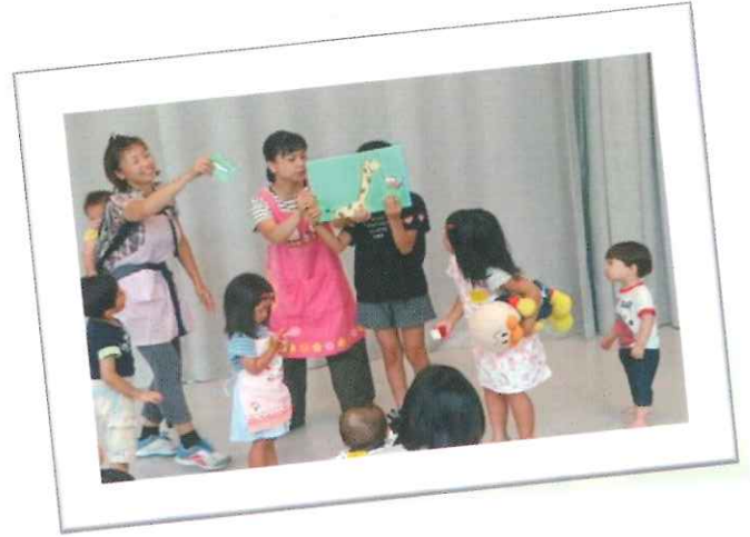
保育中の子どもさん達の様子