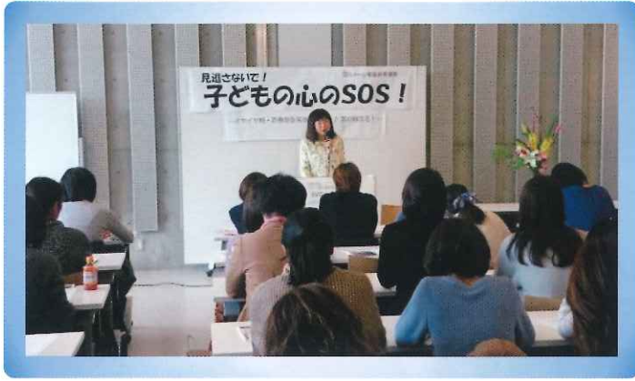
家庭教育講座を受講される皆さんの様子