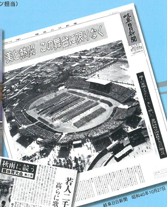
岐阜日日新聞 昭和40年10月27日