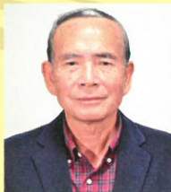
吉村功 よしむら いさお

高校時代から陸上競技に本格的に取り組む。1990年のアジアジュニア陸上競技選手権大会では、4×100mリレーで1位を獲得。その後も、1993年に開催された国体の100mで日本人初の10秒1台をマークして1位を獲得するなど活躍を続ける。大阪ガス株式会社に入社後、1996年に開催されたアトランタオリンピックでオリンピックに初出場し、その後、4回連続でオリンピック出場を果たす。最後のオリンピックの出場となった2008年の北京オリンピックでは、4×100mリレーで悲願の銅メダルを獲得した。そして、同年9月、現役を引退。現在、陸上教室「NOBY T&F CLUB」を主宰するなど陸上競技の発展に尽力している。