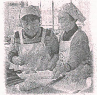
【活動に向けて勉強会】