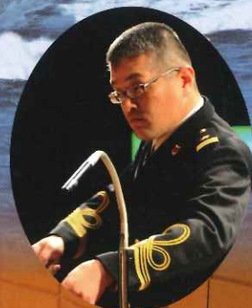
指揮者：舞鶴音楽隊隊長 1等海尉 高野 賢一