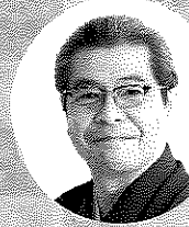
落語家 立川 志の輔