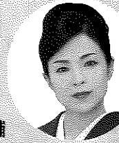
歌手 石原 詢子 ほか