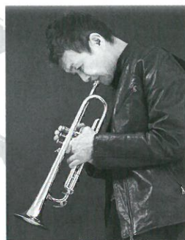
【特別ゲスト】 大野俊三 Shunzo Ohno

岐阜市出身。1974年にジャズの巨匠アート・ブレキーの誘いで渡米。ギル・エヴァンス、ハービー・ハンコック、ウェイン・ショーターら数々のジャズレジェンドと共演し、グラミー賞を2度(1984年・88年)受賞。交通事故と病気による、2度にわたるトランベッター生命の危機を乗り越えた奇跡体験のドラマは、テレビ番組でも紹介された。2014年には、世界最大級の国際作曲コンペティション「International Songwriting Competition」(ISC)で、世界120ヶ国約2万人のエントリーの頂点「最優秀賞(Grand Prize)」に輝き、日本人初の快挙を成し遂げた。