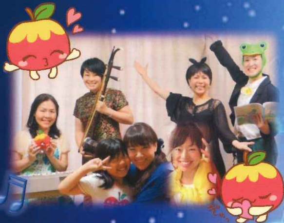
ハーモニークラブさん