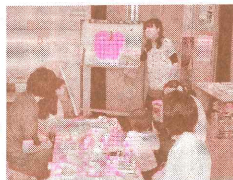
↑ はじめてのちびっこアート