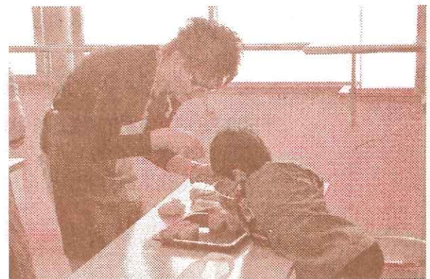
野菜いっぱい マフィンを作ろう ↑