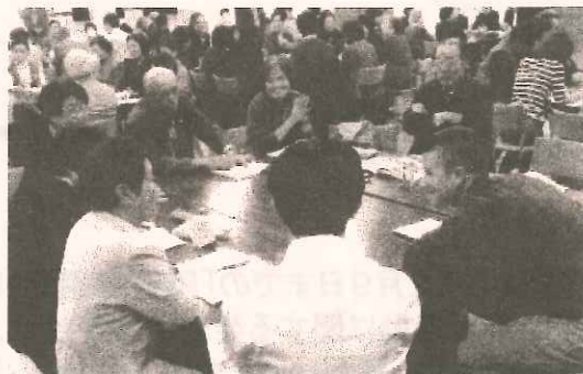
▲4つの分科会に分かれ、ボランティア・地域活動に関する発表を聞き、他市町村の方と交流をしました。