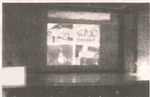
▲「住民が主役の助け合い活動～ボランティアの力をつむぐ～」というテーマの講演を聞きました。