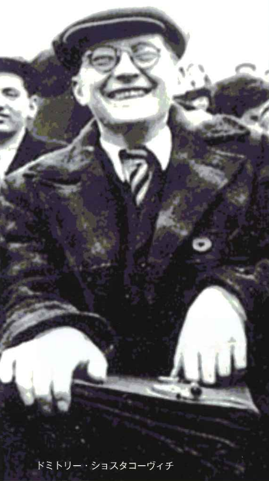
ドミトリー・ショスタコーヴィチ