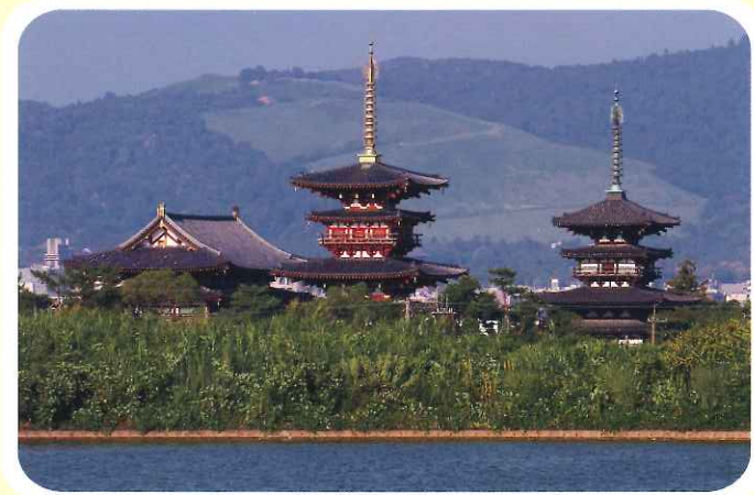
薬師寺遠景 (東塔は現在修復工事中)

このような復興事業に関わってこられたご経験を中心に、文化財の保護や薬師寺の歴史についてのお話を拝聴します。