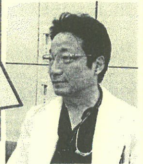
岐阜大学CKD医療連携寄附講座 特任准教授