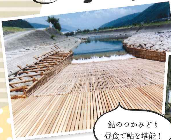
鮎のつかみどり 昼食で鮎を堪能!