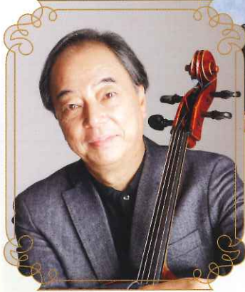
原田禎夫 (チェロ) Sadao HARADA