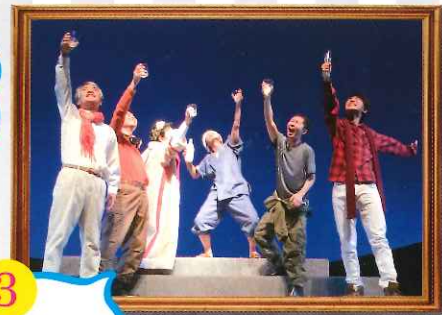
3 10/21 土 ~22 日 劇団『替』 『オレンジブロッサム』