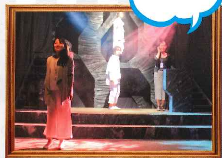
6 11/24 金 ~26 日 劇団あとの祭り 『きつねうどんと たぬきうどん』