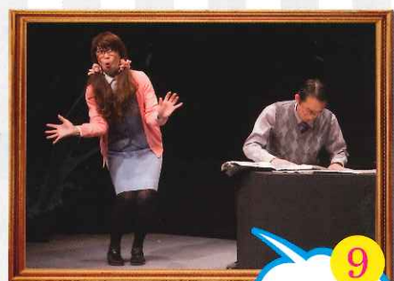
9 12/16 土 ~17 日 岐阜ろう劇団いぶき 『海へ——』