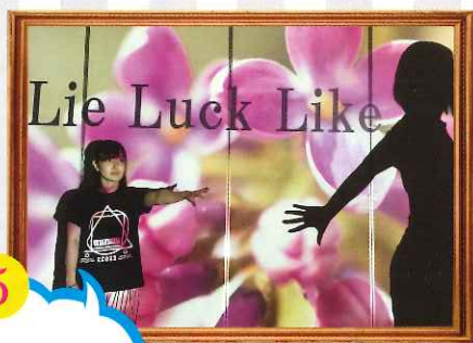
5 11/4 土 ~5 日 演劇ニッケル 『ライラックライク』