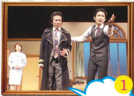
劇団ゼロ 『一人二役』