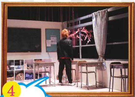
4 10/27 金 ~29 日 劇団アルデンテ 第28回公演 『ハピネス3』