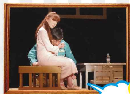
7 12/2 土 ~3 日 劇団ラッキー・キャッツ 『左目のジェニー』