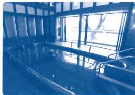
■長良川温泉は、にっぽんの温泉100選に6年連続で選出されています。

泉質は単純鉄冷鉱泉で、鉄分が多いため空気に触れると赤褐色になる湯は、リウマチ・婦人病・皮膚病等に効果があるといわれています。 ※問い合わせ/岐阜長良川温泉旅館協同組合 TEL058-297-2122