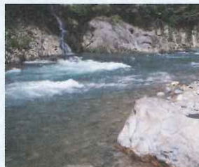
洞戸のエメラルドグリーンの清流。 会場の近くには美しい清流が流れ 温泉なども楽しめます。