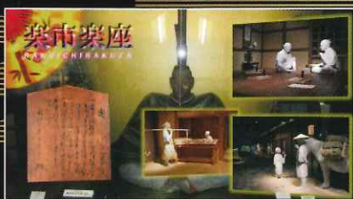
【岐阜城内】信長公像の前面ガラスを利用し、信長公と岐阜の関わりを映像で紹介!!