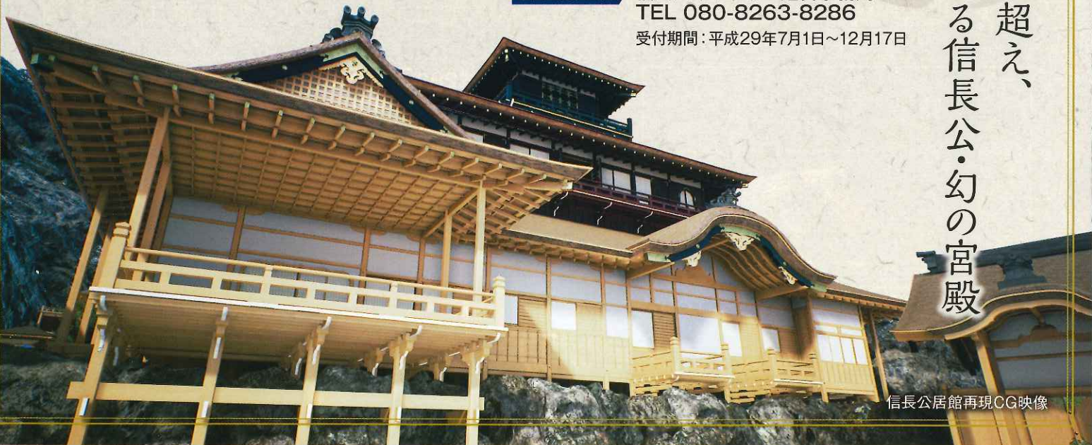
信長公居館再現CG映像

お問い合わせ先 信長公ギャラリー運営事務局 TEL 080-8263-8286 受付期間: 平成29年7月1日~12月17日