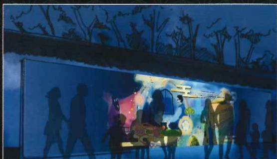
【岐阜城二の丸】白壁に見立てたスクリーンにブラックライト演出で「在りし日の信長公」を再現!!

開催期間 平成29年7月15日(土)～9月3日(日) (9月1日休み) 午後6時～午後10時 (9月2日～3日 午後9時30分まで)