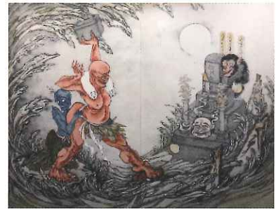
服部しほり《展覧記》2017年 個人蔵