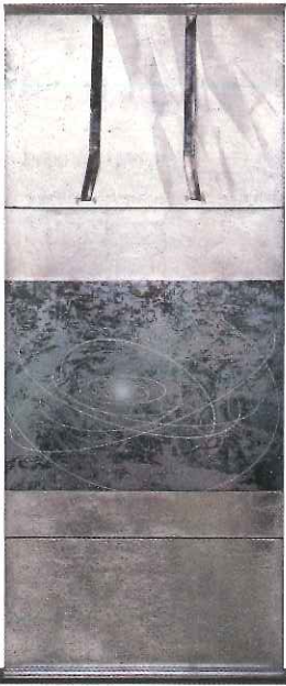
岡村智晴(orbic) 2017年 個人蔵