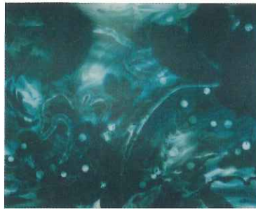
新恵美佐子《挿籃》2013年 個人蔵