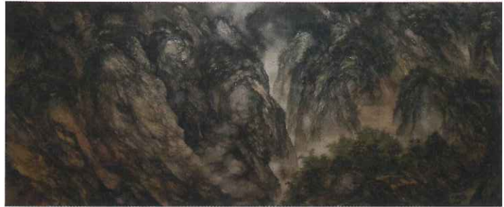
加藤良造《山水境》2015年 個人蔵