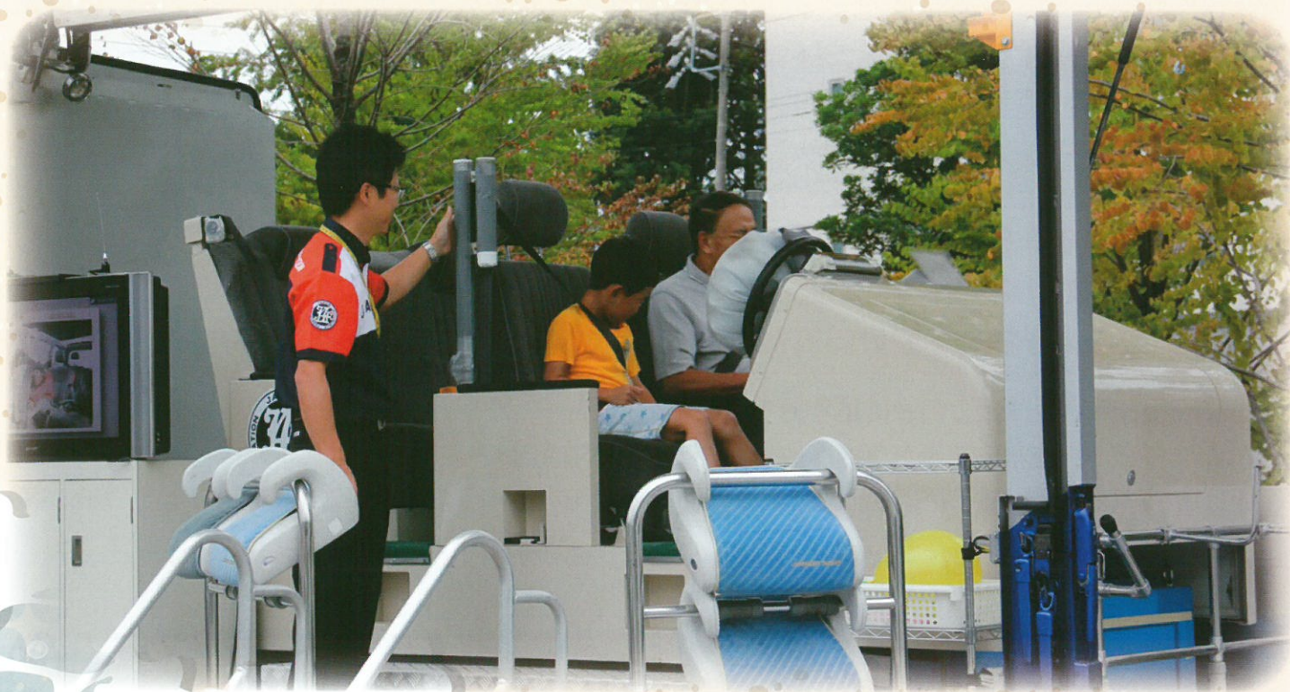
JAF岐阜支部 シートベルトコンビンサー