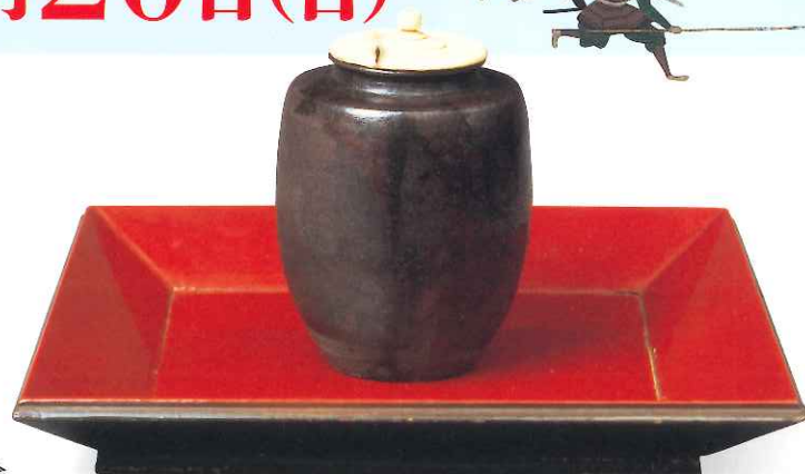
重要美術品 唐物肩衝茶入 銘勢高 瀬川美術館蔵

主 催 / 岐阜市信長公450プロジェクト実行委員会 後 援 / 駐日ポルトガル大使館、在ポルトガル日本国大使館