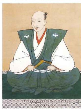
重要文化財 織田信長像(部分) 長興寺蔵 【展示期間8/11~20】