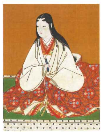
重要文化財 浅井長政夫人(お市の方)像(部分) 高野山持明院蔵 【展示期間8/1~20】