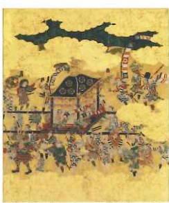
重要文化財 十二月月風俗図 六月 山口達春記念館蔵 ※会期中場面替えがあります