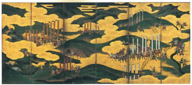
長篠合戦図屏風 名古屋博物館蔵 【展示期間7/14~30】