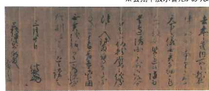
国宝 織田信長書状 上杉謙信宛 三月二十日 米沢市上杉博物館蔵 【展示期間7/14~30】

国宝 上杉家文書11点 重文 細川家文書7点を公開！ ※会期中展示替えがあります