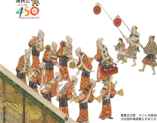
重要文化財 十二月風俗図(部分) 山口蓬春記念館蔵 ※会期中場面替えがあります