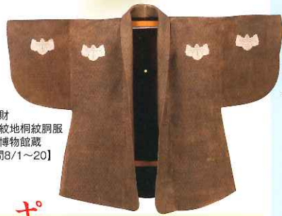
重要文化財 茶室韋小紋地桐紋桐服 上田市立博物館蔵 【展示期間8/1~20】