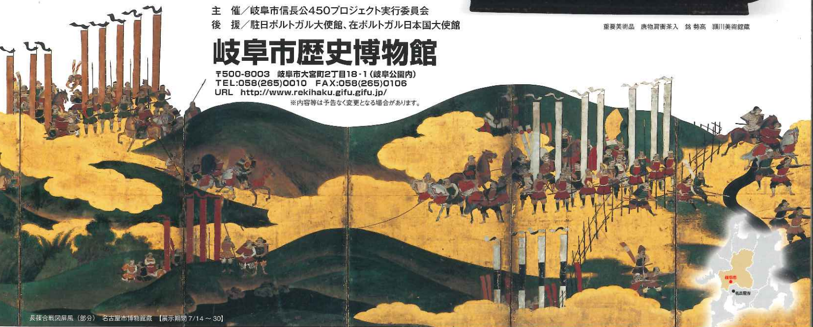
長祿合戦図屏風(部分) 名古屋博物館蔵 【展示期間 7/14～30】