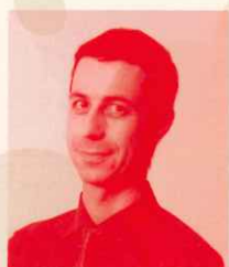
クリス・グレン タレント・ラジオDJ