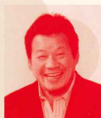
藤波 辰爾 プロレスラー