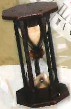
砂時計 16世紀 松本市時計博物館蔵