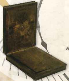
真鍮板目盛付日時計 ポルトガル製 19世紀 松本市時計博物館蔵