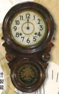
四ツ丸型掛時計 岐阜・杉山時計製 明治時代 岐阜市歴史博物館蔵