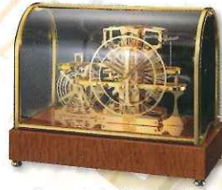
デコールセイコー 悠久 平成17年(2005) セイコークロック株式会社蔵