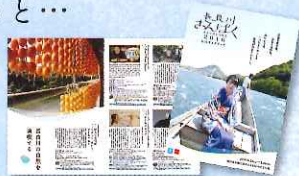
▲2016年度 公式ガイドブック