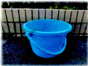
雨ざらしのバケツ、じょうろ