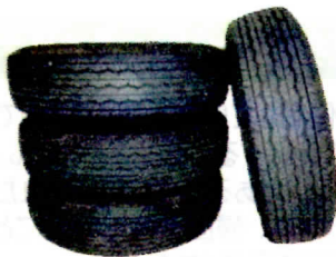
古タイヤに溜まった水たまり