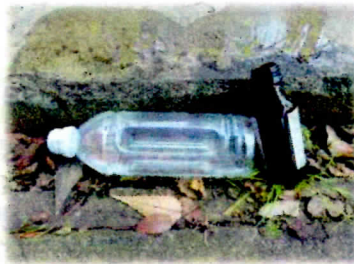
屋外に放置された空きビン、缶、ペットボトル