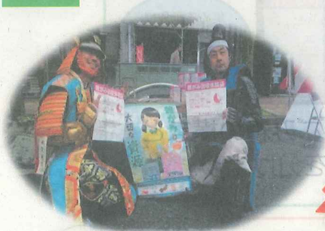
※第44回道三まつりの様子